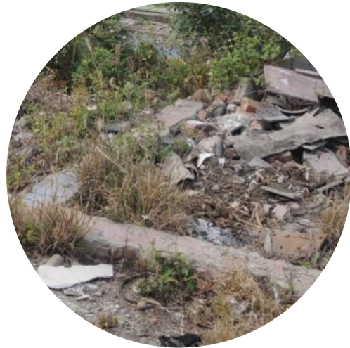
有地下槽體、管線等 或地表植被異常情形