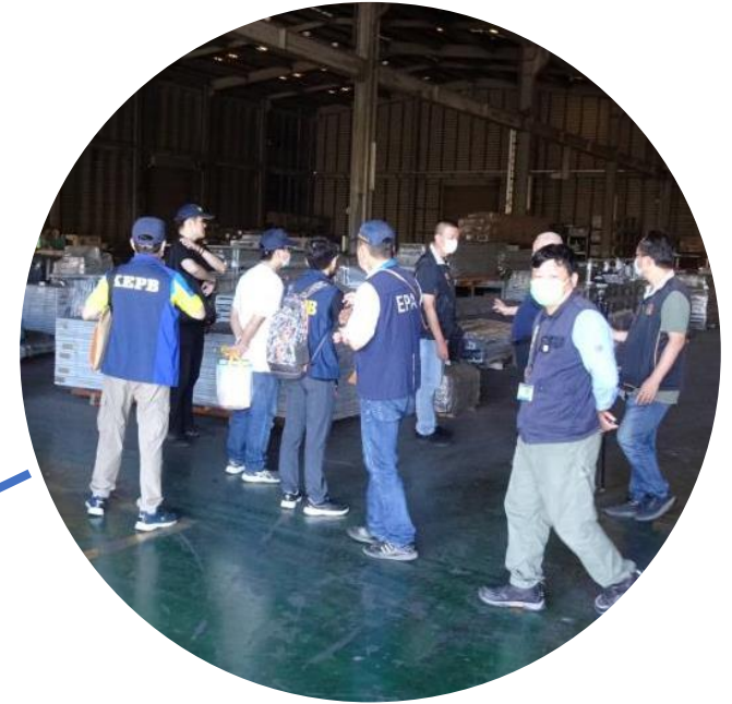
假承租真棄置 民眾出租土地 或廠房要注意 113年2月