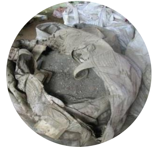
有不明廢棄物、有害物質等 棄置或散落