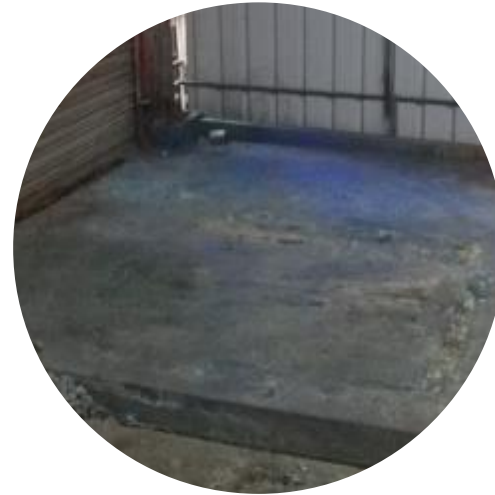
地面有不明顏色、污痕 或地坪不完整有破損