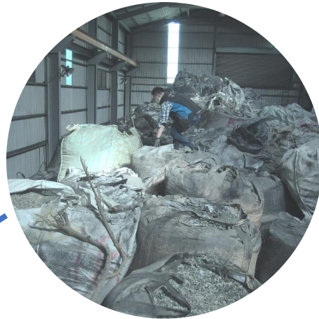
廠房出租小心! 查獲不法業者 租廠房棄置廢棄物 107年3月