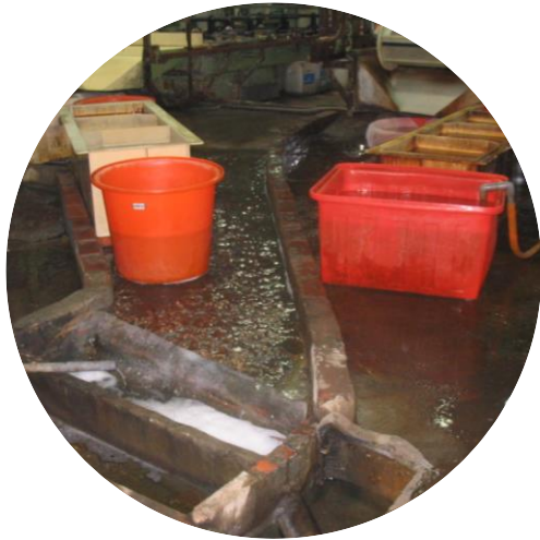
用地內有污染逸散、 廢污水溢流等情形