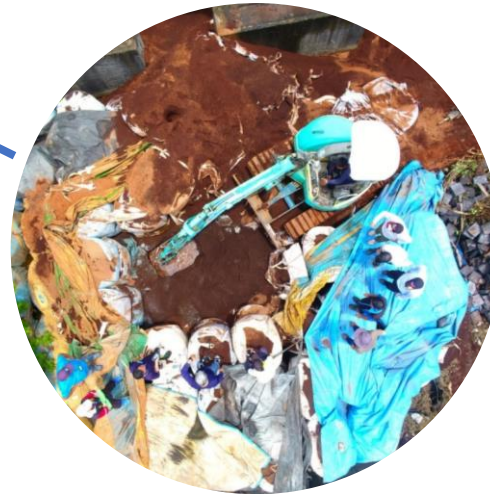
犯罪集團作案模式從 倉庫棄置廢棄物 轉變 成回填掩埋隨機棄置 110年7月