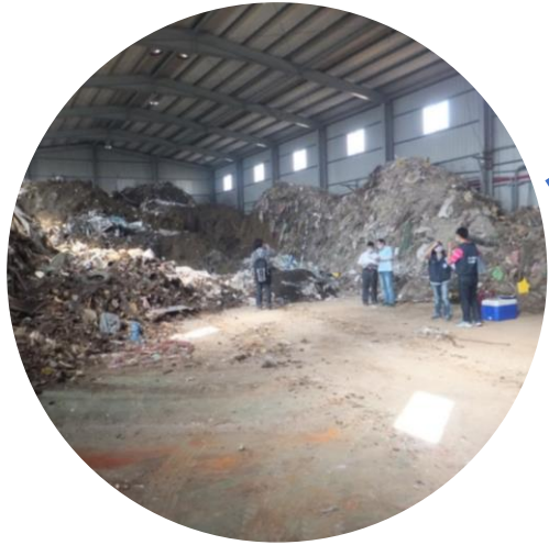
慎防先承租、後棄置 確保廢棄物不會來 105年11月