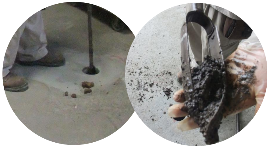
採樣示意照片(非案例用地)

事業設廠前進行用地評估調查及土壤檢測，結果發現用地土壤重金屬銅超過法規標準(管制標準)，由於事業尚未營運，即可釐清該污染應非該事業所造成。